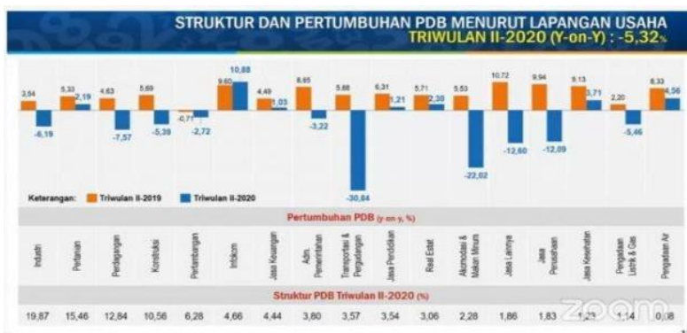
Gambar 1. Struktur dan Pertumbuhan PDB Menurut Lapangan Usaha

dibedakan dari metode pembayaran. Jika prabayar berarti pengguna melakukan transaksi pembayaran terlebih dahulu agar mendapatkan layanan, sedangkan pascabayar berarti sebaliknya menggunakan layanannya terlebih dulu baru melakukan pembayaran. IM3 Ooredoo memiliki jaringan yang kuat sehingga bisa dijangkau sampai kedaerah terpencil (indosatooredoo.com).